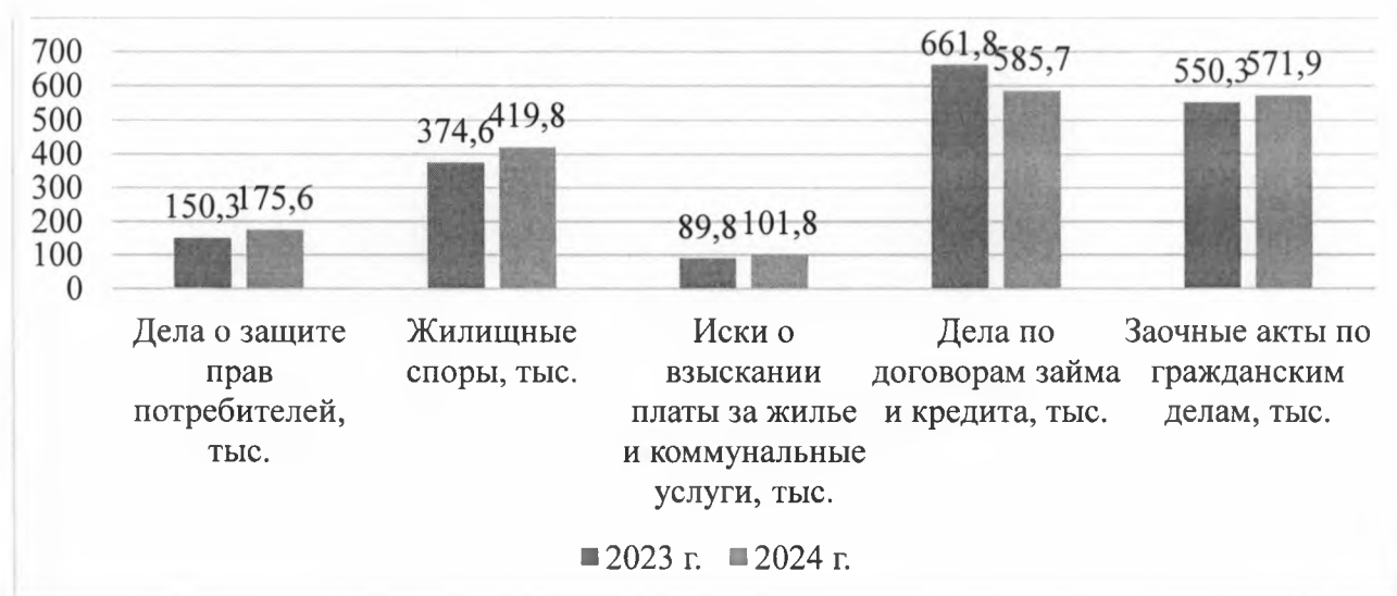
Рисунок 2.1. Показатели гражданского судопроизводства в районных судах Российской Федерации за 2023-2024 гг. 3

Смысл этих правил лучше виден, если учитывать не только текст закона, но и реальную судебную нагрузку. В 2024 г. в районных судах заметно выросло число дел о защите прав потребителей: с 150,3 тыс. до 175,6 тыс. Увеличилось и количество жилищных споров – с 374,6 тыс. до 419,8 тыс. Больше стало исков о взыскании платы за жилье и коммунальные услуги: с 89,8 тыс. до 101,8 тыс. В то же время дела о взыскании сумм по договорам займа и кредитным договорам сократились с 661,8 тыс. до 585,7 тыс. (рисунок 2.1).